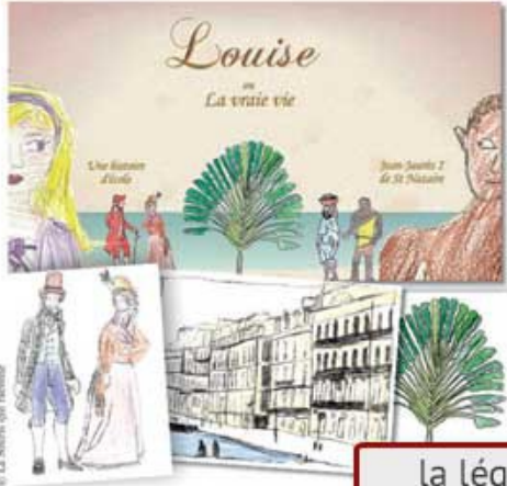
Louise ou la vraie vie est vendu sur www.lasourisquiraconte.com au profit de l'Union des Associations des Parents d'Enfants Déficients Auditifs).