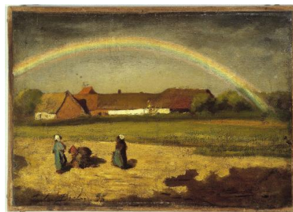
L'Arc en ciel à Courrières