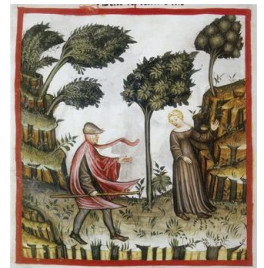
Vent du Nord