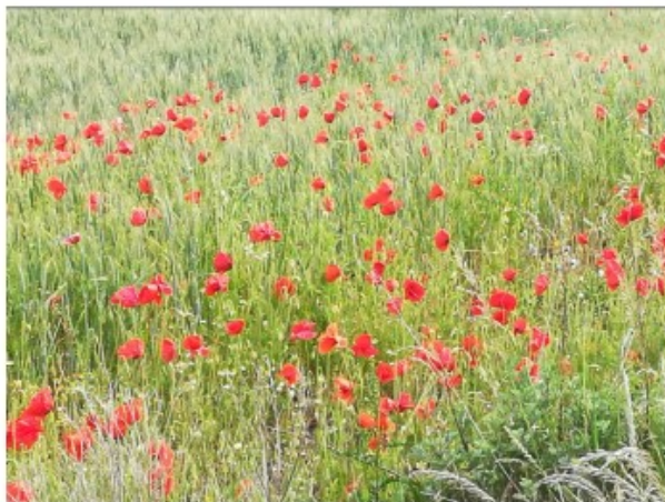
Champ de coquelicots