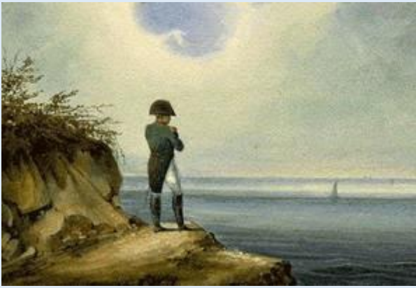
Doc 8 : Napoléon sur l'île d'Elbe

L'armée napoléonienne, décimée lors de la campagne de Russie ne peut résister bien longtemps à la coalition . Les troupes ennemies marchent rapidement sur Paris. Malgré une belle résistance, Napoléon doit s'avouer vaincu et, le 6 avril 1815, il est contraint d'abdiquer .