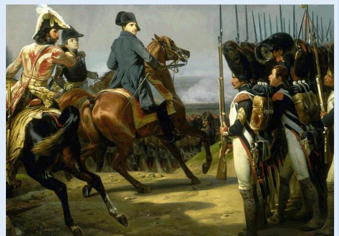
Doc 7 : Napoléon passe ses troupes en revue à la bataille de Iéna

L'Empire français est divisé en 130 départements. Les états dépendants de l'Empire ont à leur tête l'Empereur lui-même ou des membres de sa famille. Ainsi, les propres frères de Napoléon sont roi de Naples, roi de Hollande et roi de Westphalie. Les ennemis sont devenus des alliés. Napoléon divorce de Joséphine qui ne pouvait lui donner de descendance et épouse Marie-Louise, la fille de l'Empereur d'Autriche qui lui donne un fils, le roi de Rome. Sa descendance est assurée. Napoléon est au sommet de sa gloire.