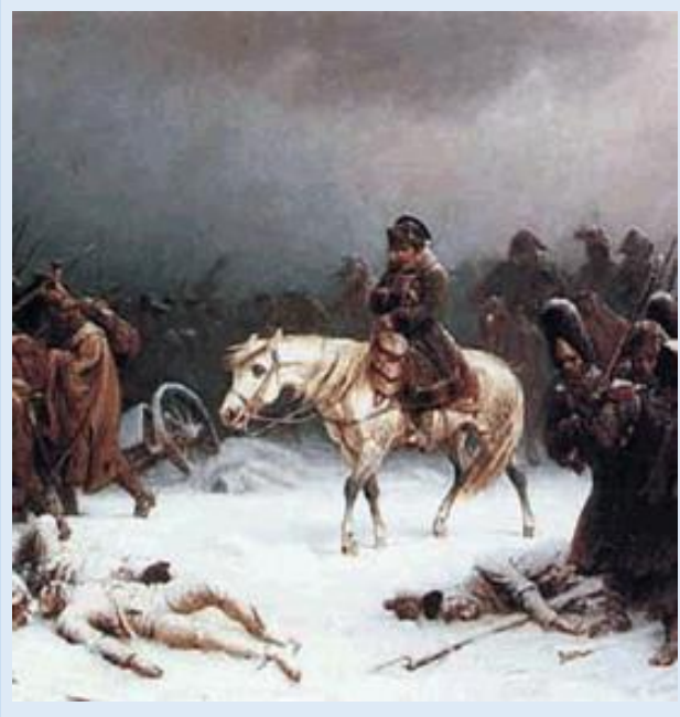
Doc 7 : La retraite de Russie

Napoléon a de nombreux ennemis en France . Les royalistes, les paysans que les guerres maintenaient dans la misère et qu'on recrute pour se faire tuer sur les champs de bataille. Hors de France, Les ennemis battus cherchent leur revanche. Les peuples considèrent la France comme l'occupant. L'Espagne, qui continue de résister épuise les forces armées napoléoniennes. C'est alors que le Tsar de Russie accueille des bateaux anglais dans ses ports, rompant ainsi le blocus. Napoléon lui déclare la guerre . Il espère une victoire rapide mais l'hiver russe vient à bout de l'armée napoléonienne . Plus de 500 000 hommes mourront . Voyant que l'Empereur n'était plus invincible, tous ses alliés d'hier l'abandonnent. La Prusse, l'Autriche et l'Angleterre s'allient à la Russie et les premières défaites s'enchaînent. Napoléon est chassé d'Allemagne.