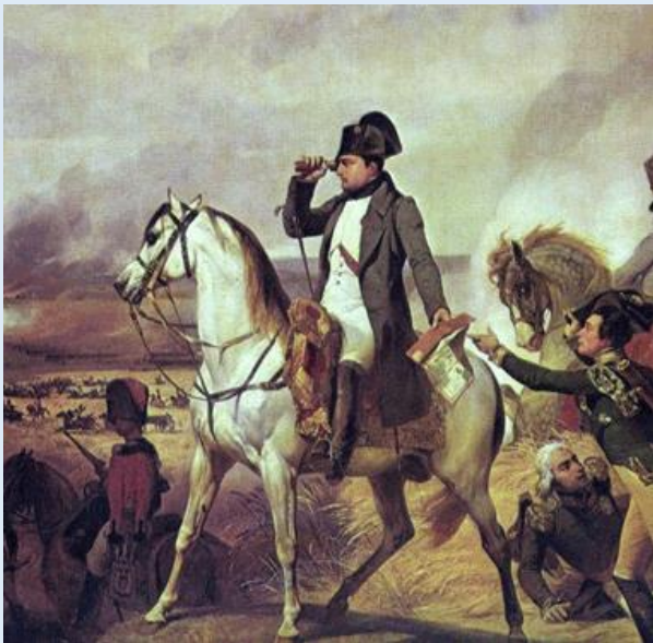
Doc 6 : Napoléon à la bataille d'Austerlitz

Napoléon continue les guerres de la Révolution. Les nations voisines, inquiètes par l'ambition du nouvel empereur et par sa volonté de repousser sans cesse les frontières de son empire forment une coalition pour ramener un roi sur le trône de France . Mais avec son armée de 2 millions d'hommes, fidèles et bien entraînés et, grâce à son génie militaire, Napoléon va de victoires en victoires. À Austerlitz, en 1805 , contre les Autrichiens et les Russes, à Iéna, en 1806 , contre les Prussiens. Peu à peu, les ennemis d'hier s'allient à la France et signent des traités de paix. Seule l'Angleterre lui résiste grâce à sa flotte invincible. Napoléon tente bien un débarquement mais est défait à la bataille de Trafalgar où la flotte française sera détruite. Il organise alors un blocus pour empêcher tout commerce entre l'Angleterre et le continent.