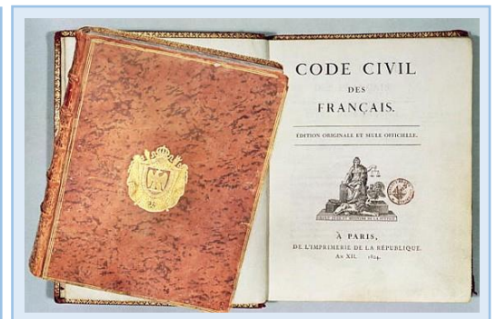
Doc 2 : Le code civil de 1804

En revanche, Bonaparte ne se soucie guère des conditions de vie du peuple. Malgré tout, il bénéficie d'une grande popularité grâce, entre autres, à ses victoires militaires