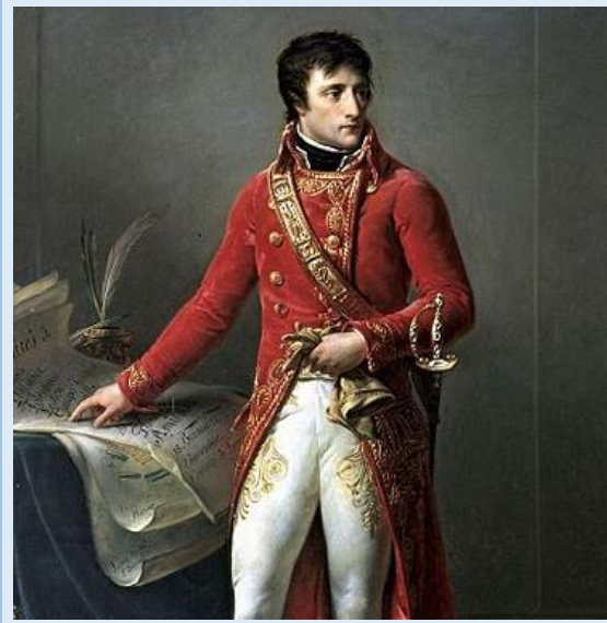
Doc 1 : Bonaparte, 1 er Consul en 1804

Il propose les lois, nomme les ministres et les juges, il commande les armées, sa police à pleins pouvoirs et les journaux sont surveillés. Dans les faits, la France est une République dirigée par un dictateur .