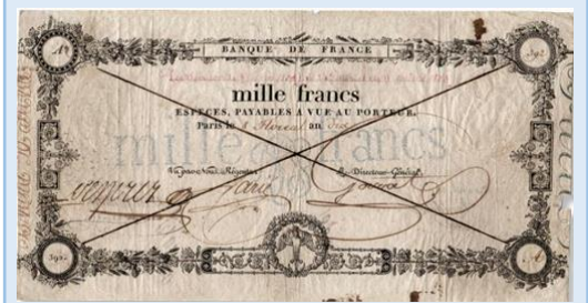
Doc 3 : Premier billet de la Banque de France