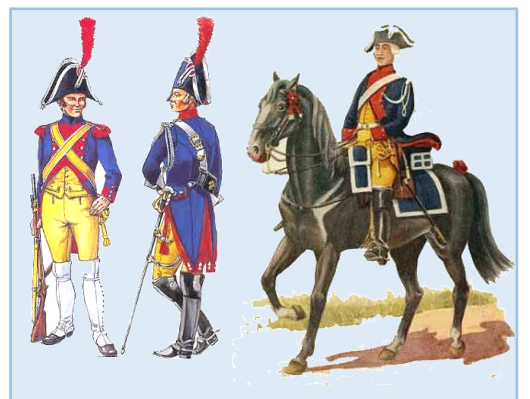
Doc 4 : Gendarmes sous le consulat