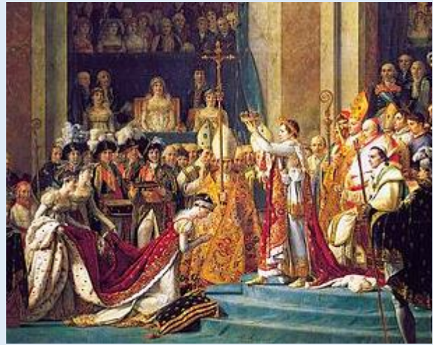
Doc 5 : Le sacre de Napoléon

Il s'entoure également d'une cour, crée une noblesse d'empire, nomme les évêques, des ducs et des princes. La France n'est plus une république mais un empire.