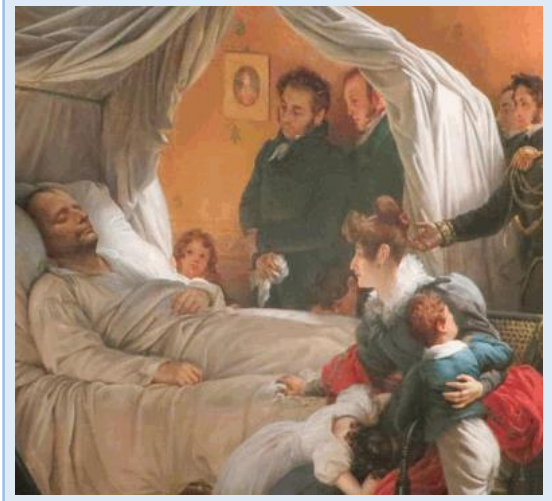
Doc 9 : mort de Napoléon à Saint Hélène

Louis XVIII se rend vite impopulaire en France. Napoléon y voit une chance de faire son grand retour. Il débarque le 1 er mars 1815 en Provence . Les troupes venues l'arrêter s'allient à lui et Napoléon se met en marche sur Paris. Partout, l'annonce du retour de l'Empereur déclenche un énorme élan de ferveur populaire. Il lève une armée dans l'espoir de reconquérir son empire mais c'est un nouvel échec et Napoléon est écrasé par les troupes anglaises à Waterloo le 18 juin 1815 . Son retour n'aura duré que cent jours . Napoléon est emprisonné sur l'île de Saint Hélène où il mourra en 1821 . Un roi, Louis XVIII règne à nouveau en France.