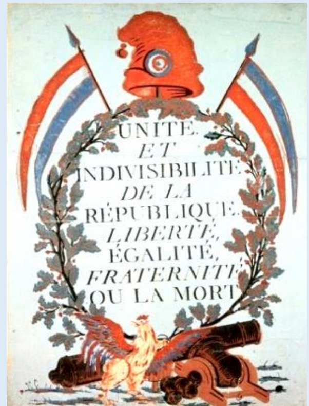
Doc 2 : Les symboles de la République : drapeau bleu, blanc, rouge et bonnet phrygien

Les principaux bénéficiaires de ces réformes sont les bourgeois qui s'enrichissent en achetant les terres de l'Eglise .