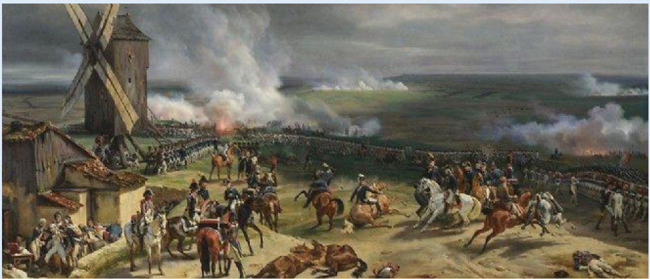
Doc 3 : 20 septembre 1792. Victoire des volontaires à Valmy

Les royaumes d'Europe, inquiets par la propagation des idées révolutionnaires décident d'y mettre un terme et, au printemps 1792 , les armées autrichiennes et prussiennes pénètrent en France par l'Est du pays. L'Assemblée Nationale déclare « la patrie en danger » et des milliers de volontaires s'engagent pour défendre leur pays contre l'envahisseur. Rouget de l'Isle écrit pour les volontaires marseillais un chant révolutionnaire : la Marseillaise .