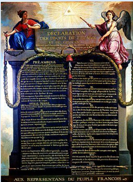
Doc 1 : La Déclaration des droits de l'homme

Les révoltes dans les campagnes, après la prise de la Bastille inquiètent les députés de l'Assemblée nationale. Afin de rétablir l'ordre et d'éviter un embrasement général, l'abolition de tous les privilèges détenus par le Clergé et la noblesse est votée le 4 août 1789 . Chacun est donc sur un pied d'égalité face à l'impôt .